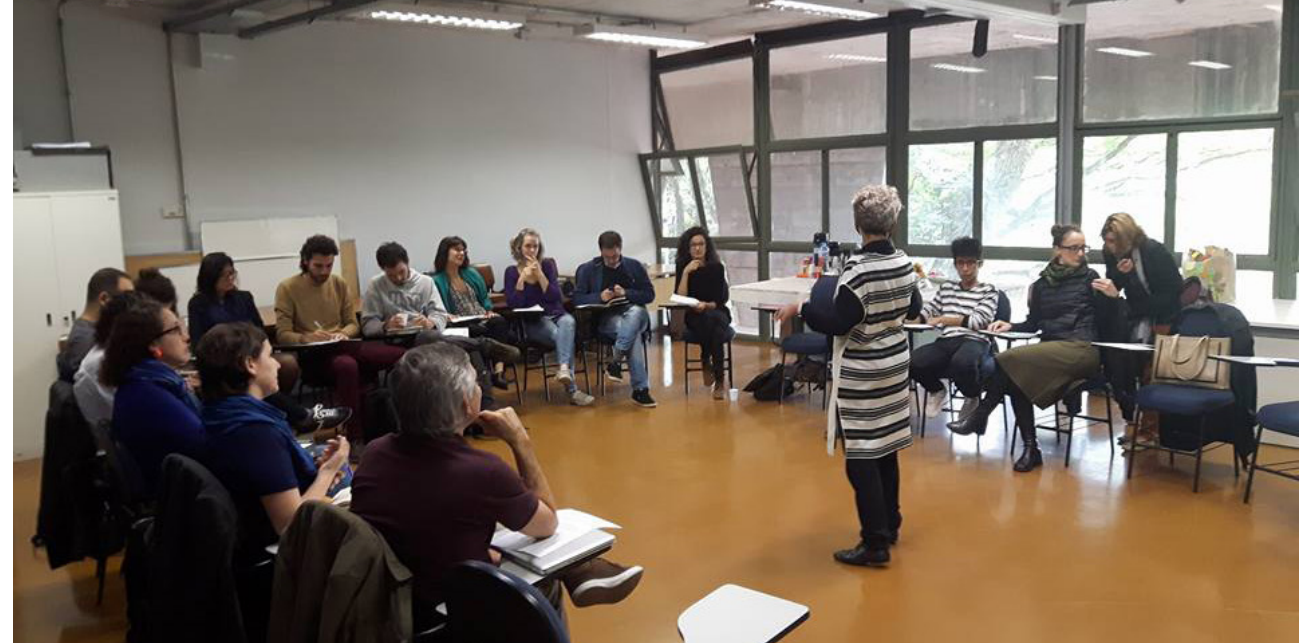
Img. 7 Reunião com parceiros do LabCidade sobre o mapeamento dos atores e ações.

[11] A estrutura da Plataforma é constantemente revisada pelos pesquisadores. Na sua última versão, o questionário aparece estruturado em seis blocos de perguntas que, em relação ao Urbanismo Neoliberal, investigam seus agentes envolvidos, mecanismos de parceria, ações relacionadas às políticas públicas realizadas pelo Estado e ações jurídicas, instrumentos e dispositivos jurídicos e de comunicação, custos e recursos e tipos de financiamento. Em relação ao Urbanismo Biopotente, as perguntas são estruturadas de forma que, ao mesmo tempo, seja feito um espelhamento com o que é investigado na outra categoria, e faça sentido com o que está sendo cartografado. Dessa forma, investigam os agentes apoiadores, a rede formada por eles, as ações no que diz respeito às políticas públicas auto-engendradas pelos moradores e ações jurídicas, os instrumentos jurídicos e de comunicação, os recursos e o financiamento, relacionado a instituições e/ou acordos comerciais.