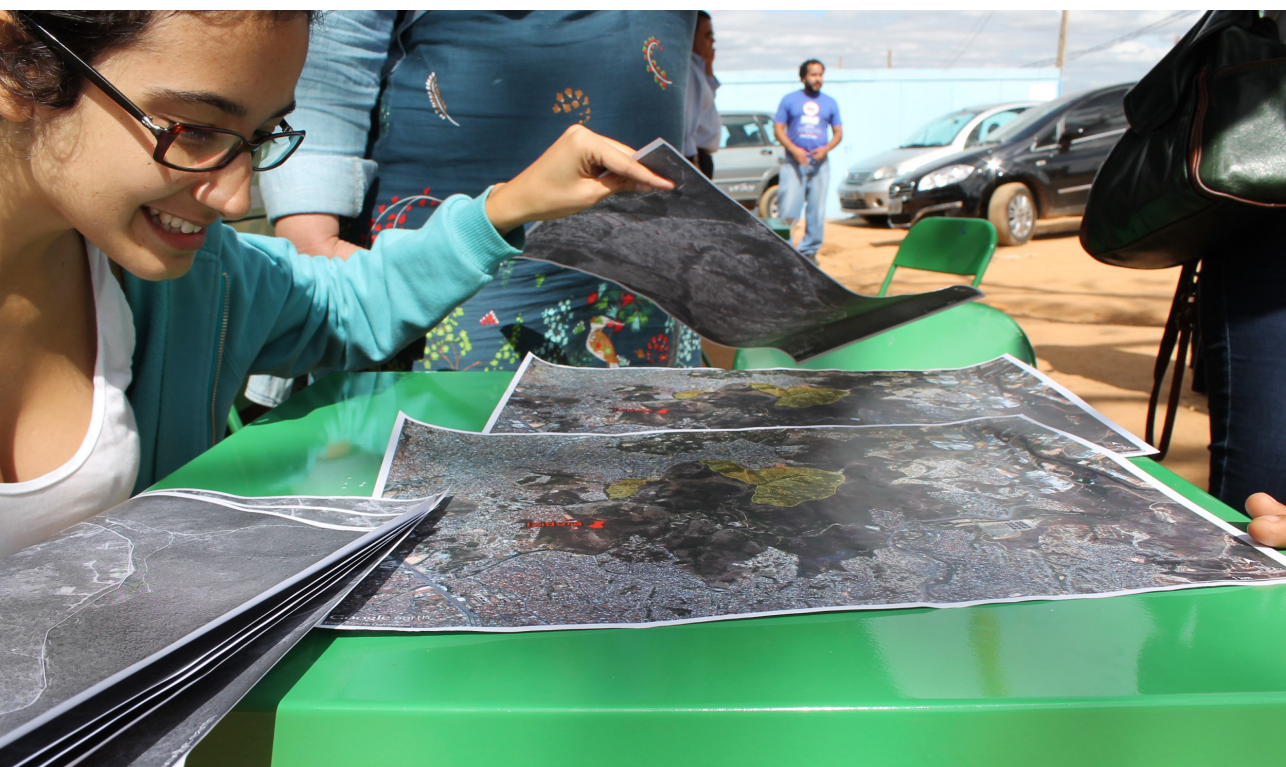
Img. 5 Cartografia da cultura realizada na ocupação Vitória.